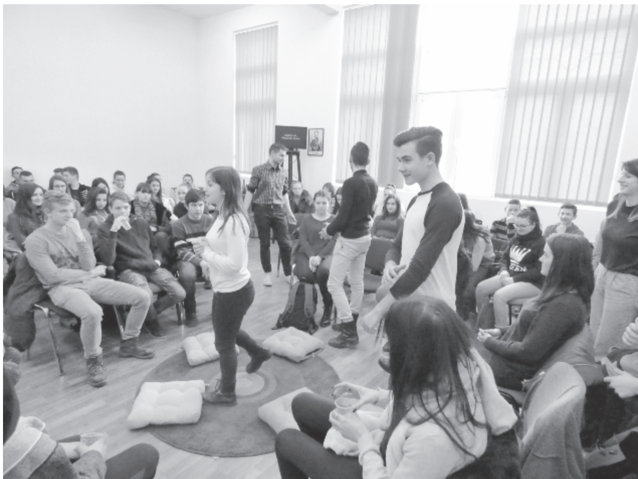
Interaktív előadás, amely szinte észrevétlenül kapcsolja be a játékba a nézőket is