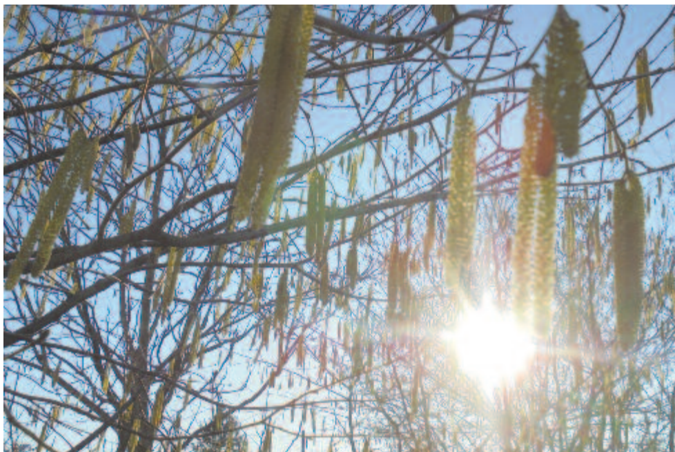
Megnyurgult mogyoróbarkák sárga virágporesői alatt

Március 12. Szent Gergely, a tanárok védőszenájének ünnepe. Keservesen szép napja ez a vásárhelyi magyar középiskoláknak. Jőmagam, bolyaisként: református kollégistaként, s református iskolai tanárként is, a bulvárdi katolikus középiskoláért, a II. Rákóczi Ferenc Római Katolikus Gimnázium ért ejtek szót.