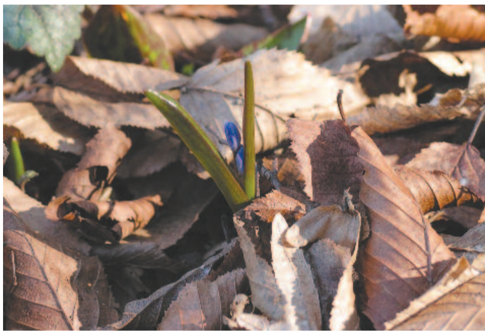
Mint egy kicsiny gyermek, aki bölcsőjébe feloldatván szökdös anyjának ölébe

Nagy kedvességgel van kiderült ideje, Zöld füvekkel borult játékos mezeje. Virági lobognak kiesült térségén, Mellynek a csendes szél jár egyenességén. Szagoskodik széjjel, ajánlja illatját. Gyémántsínre festi reggeli harmatját. Virágos zöldségű völgyeket kerekít, Mellybe igen kedves játékokat indít. Híves patakot ereszt az heggyekről,